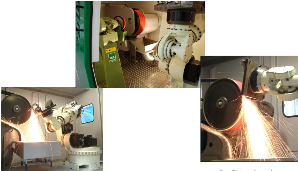
Power Grinder guards removed